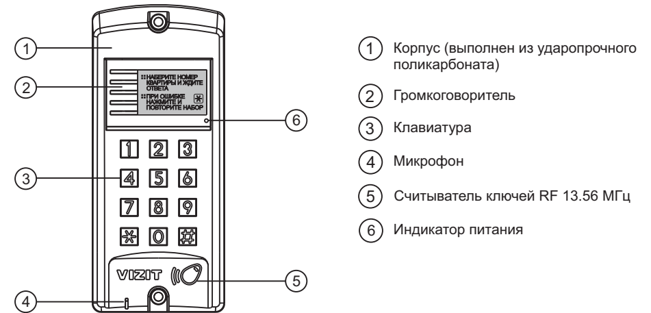
Рисунок 1 - Внешний вид блока

Блок вызова домофона БВД-310F (в дальнейшем - блок вызова) используется совместно с блоками управления БУД-302М (БУД-302К-20, БУД-302К-80) как составная часть многоквартирных домофонов и видеодомофонов VIZIT (серия 300).